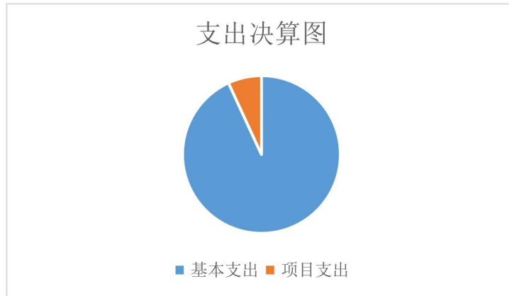
图 2. 支出决算图